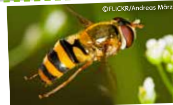
„Ich bin nicht gefährlich! Ich bin eine Schwebfliege und steche nicht“

Die Schwebfliege wird durch ihre Farbe und Form oft auch mit der Wespe verwechselt. Für die Rose sind die Larven der Schwebfliege wahre Helden. Die Weibchen legen ihre Eier nämlich gezielt in Blattlauskolonien ab, wo sich die Larven bis zur Verpuppung mit etwa 900 Blattläusen ernähren.