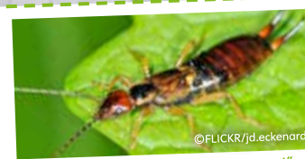
„Blattläuse habe ich zum Fressen gern!“

Blattläuse, Spinnmilben und Insekten Eier sind vor dem Ohrwurm nicht sicher. Dieses Raubinsekt macht besonders nachts Jagd auf die Schädlinge der Rosen.