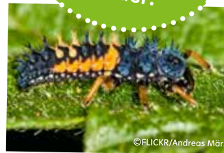
„Ich bin kein Schädling! Bitte lasst mich auf euren Pflanzen sitzen!“

Die Marienkäferlarven sind gleich in 3-facher Richtung nützlich: Sie werden in kürzester Zeit nicht nur mit Blattläusen, sondern auch mit Spinnmilben und Rosenzikaden fertig. Durch seine schwarze Farbe mit gelben Flecken ähnelt er noch nicht dem ausgewachsenen Tier und kann auch fälschlicherweise schnell als Schädling durchgehen.